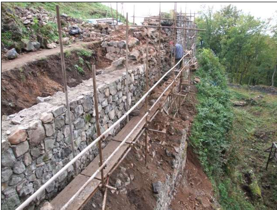
(Kumburk – oprava okružní hradby u Studniční věže)