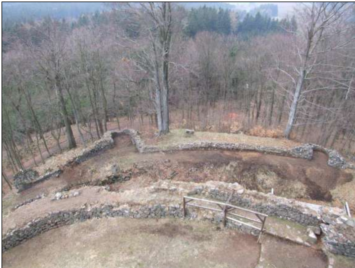
(Kumburk – hradby – úseky u bran po vyčištění terénu)