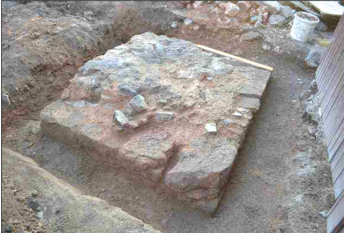
(Kumburk – torzo mohutného armovaného pilíře u malého sklepa)