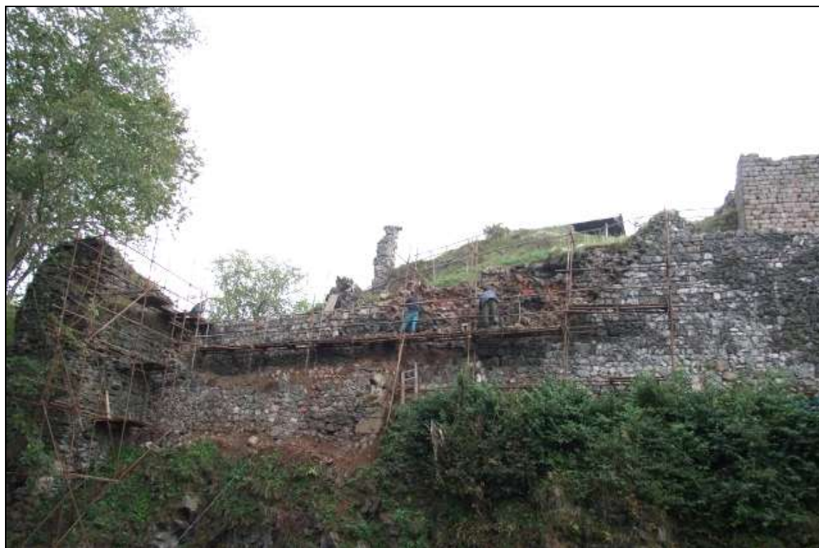
(Kumburk – oprava okružní hradby u Studniční věže)